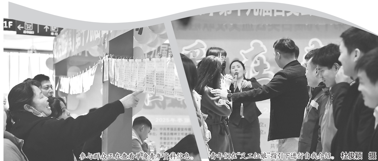
参与群众正在查看单身青年资料信息。