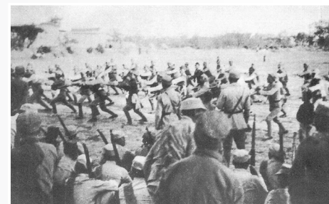
→1938年4月，东进纵队在枣强县进行刺杀训练。