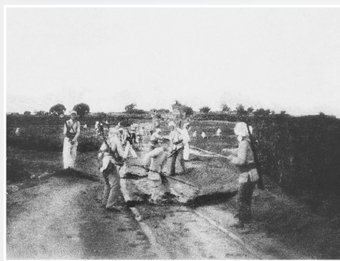
←1944年，破击阜东公路交通线、围困敌据点、保卫秋收，阻击敌人下乡抢粮。