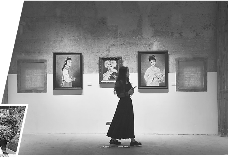
游客在长守戏剧谷欣赏《红楼梦中人》画展。